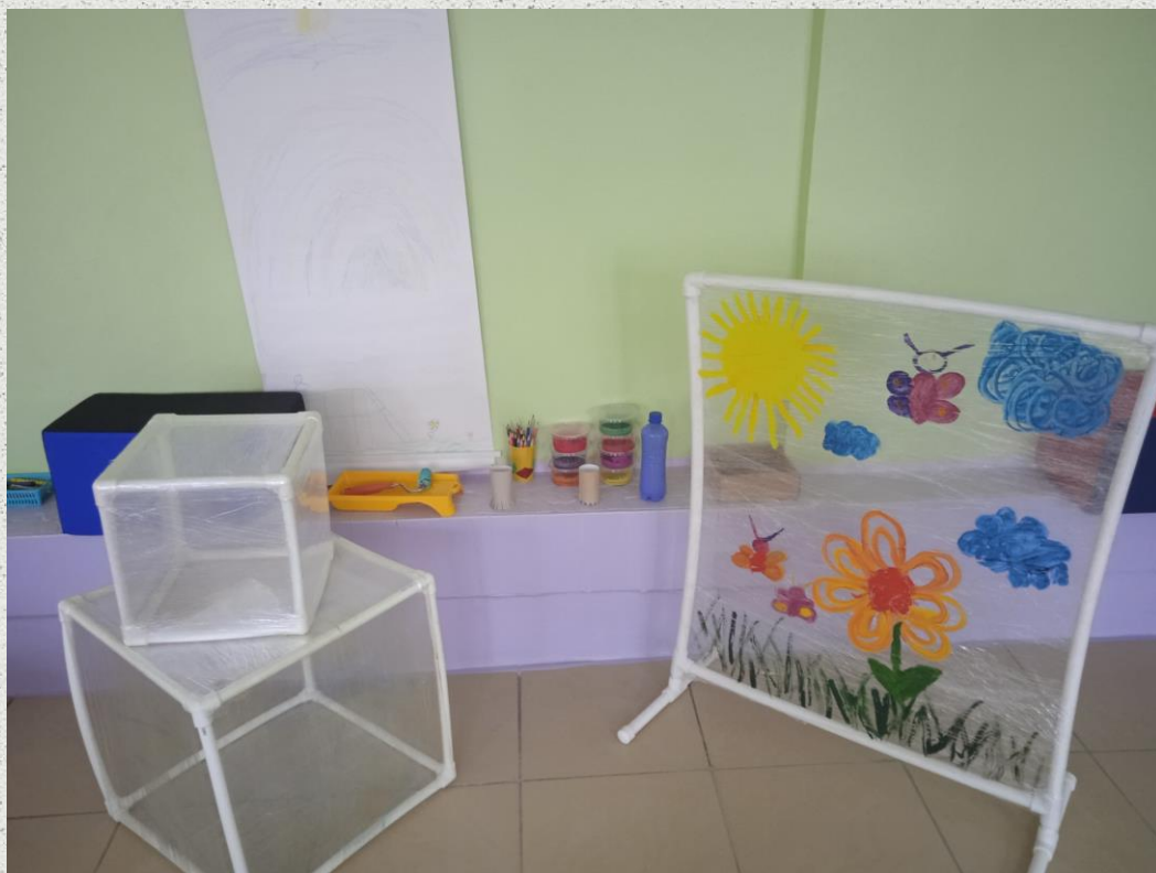
Планшеты для рисования